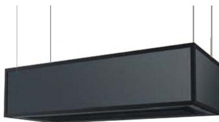
Variante: ohne Regalelemente

*Artikelergänzungen verlängern die angegebenen Lieferzeiten