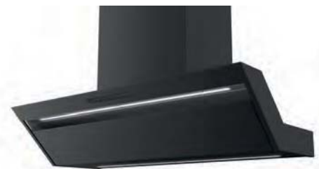
Variante: BKH 90 FO Mattschwarz